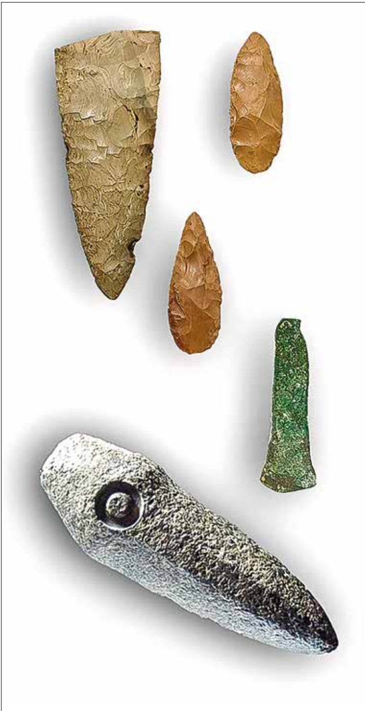
Fig. 3 - Lama di pugnale e foliati in selce (loc. Gaibola-Farneto); piccola ascia in rame (Ca' Poggio); martello litico (Grotta del Gufo) (Museo della Preistoria "L. Donini").

gono a cavaliere della direttrice transvalliva Savena-Idice-Zena, cominciando proprio dal sistema carsico alle spalle del Farneto, dove le cavità che costellano le Buche dell'Inferno, di Goibola e di Ronzana hanno restituito, grazie all'opera del GSB-USB diverse situazioni di rilievo: i materiali della Grotta Secca e della Grotta Novella, l'ascia-martello accostabile ai tipi