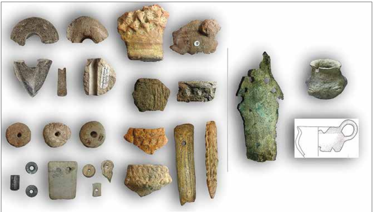
Fig. 6 - Cima di Monte Castello. Materiali eneolitici: manufatti levigati, fr. ceramici, oggetti ornamentali in pietra e utensili in osso; età del Bronzo: fr. di spada e vaso miniaturistico (Museo della Preistoria "L. Donini").