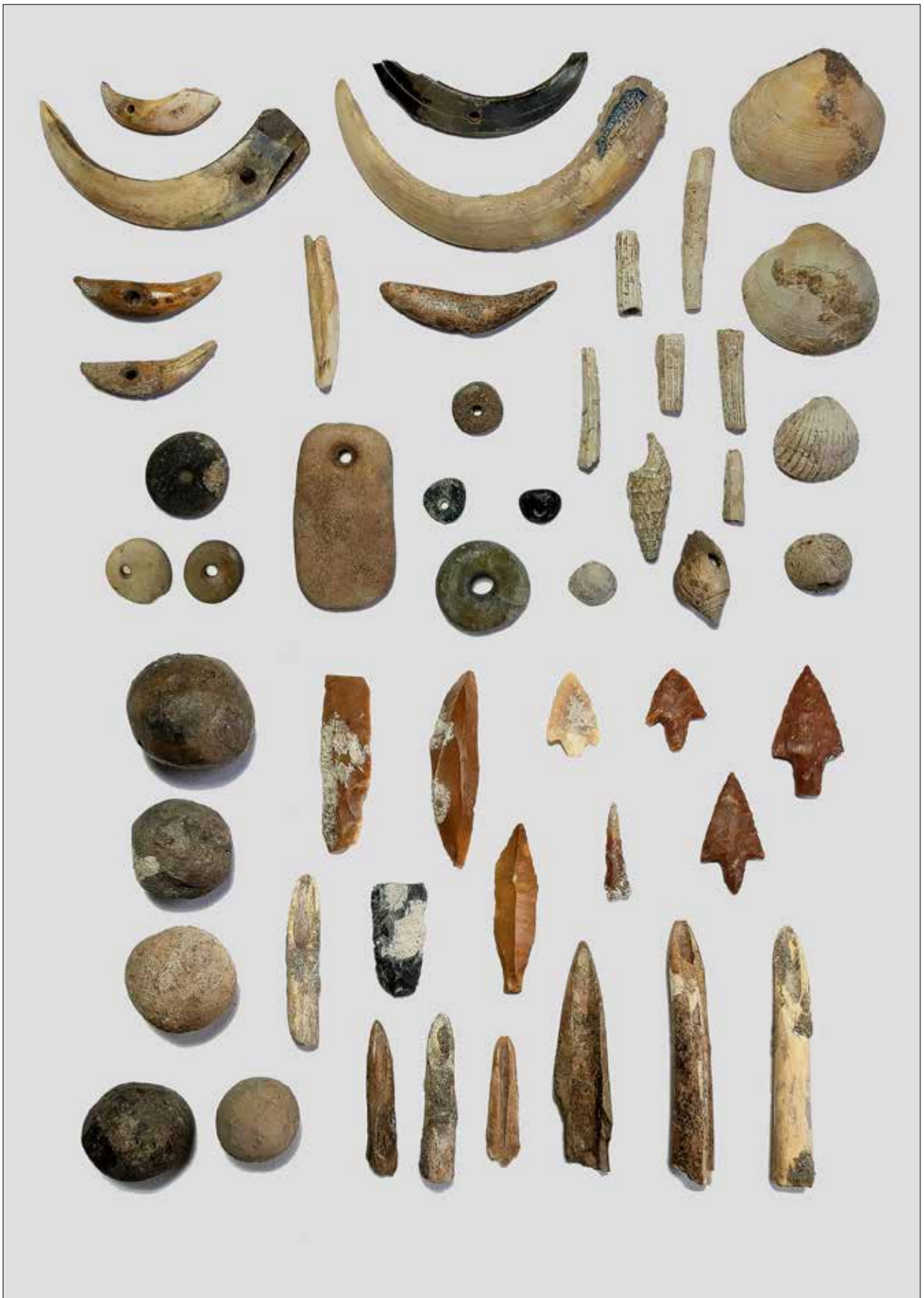
Fig. 1 - Oggetti ornamentali e utensili in materia dura animale, pendenti e vaghi in calcare e steatite, palline in terracotta, industria litica in selce dal Sottoroccia del Farneto (Museo della Preistoria "L. Donini").