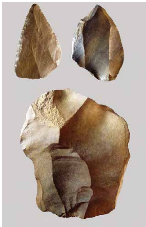
Fig. 4 - Punta levallois e nucleo e a stacchi centripeti della collezione Fantini dalla zona della Croara (Museo della Preistoria "L. Donini").

Un secondo complesso, ben distinguibile per la freschezza del taglio e le patine bruno-beige, è ascrivibile alla fase medio-recente del Paleolitico medio. I reperti provengono, in buona parte, dai «giacimenti di superficie» di Pizzicarola e, in deposizione secondaria, dalla Dolina della Spipola, dai depositi ipogei dell'Acqua-