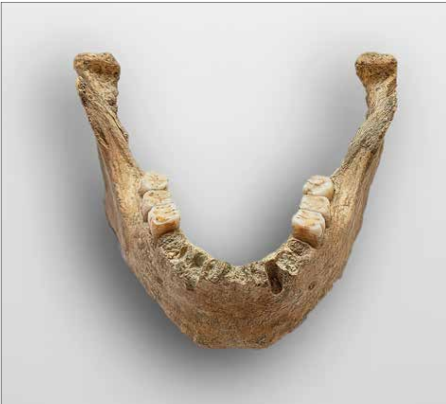
Fig. 12 - Mandibola rinvenuta dal GSB-USB nel Buco dell'Osobuco (Museo della Preistoria "L. Donini").