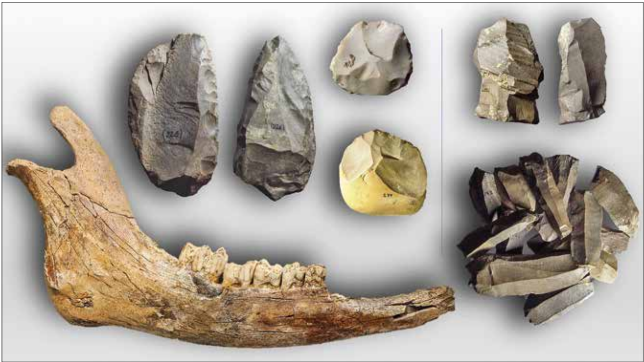
Fig. 10 - Cava I.E.C.M.E. Emimandibola di Bison priscus e industria litica del Paleolitico medio dagli Inghiottittoi A e C; a ds. nuclei e gruppo di lame del Paleolitico superiore dall'Inghiottitoio SIA (Museo della Preistoria "L. Donini").

no tre inghiottittoi (denominati A - B - C), già parzialmente sventrati dalle attività estrattive, ma dove era ancora possibile campionare le serie sedimentarie e i relativi contenuti.