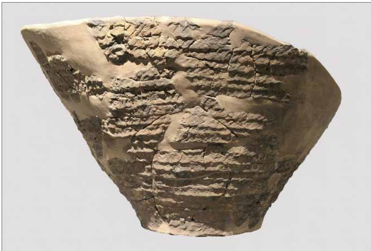
Fig. 2 - Grande vaso con superfici trattate a squame dal Sottoroccia del Farneto (Museo della Preistoria "L. Donini").

È noto che una parte dei rinvenimenti del Sottoroccia rimanda a una situazione di tipo insediativo senso lato, non direttamente interagente con il contesto funerario. In effetti, la struttura geologica composta del Farneto, con i suoi smottamenti e frane naturali, ma più ancora l'interazione della Cava Calgesso - in essere già prima della scoperta del deposito - hanno contribuito a far sì che i punti di prelievo del materiale archeologico e antropologico nell'arco delle quarantennali ricerche non possano essere coincidenti e che siano state messe in relazione fra loro situazioni