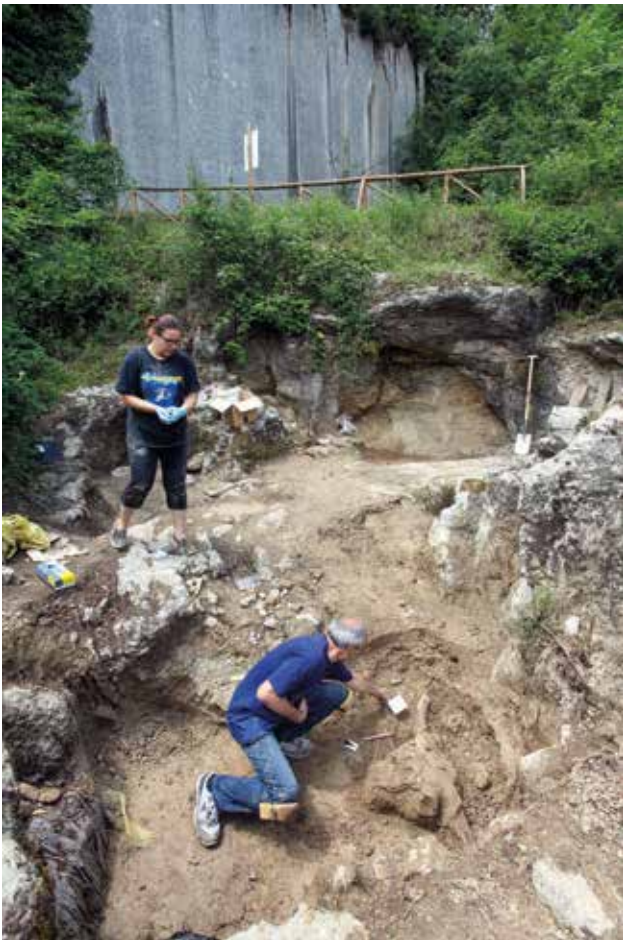
Fig. 5 - Il deposito paleontologico della Cava a Filo in corso di scavo (Museo della Preistoria "L. Donini").

spidi di freccia di fattura molto fine e diversi oggetti di adorno potrebbero rappresentare l'esito di situazioni funerarie andate in dispersione 17 .