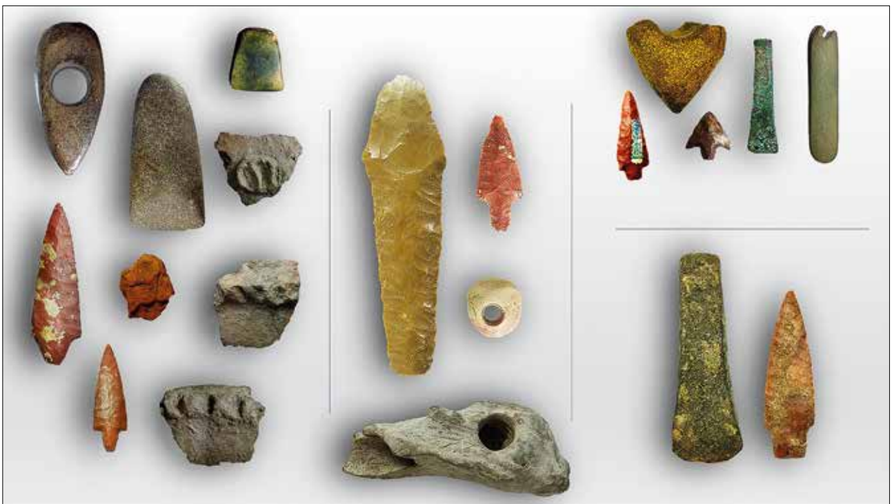
Fig. 7 - Podere Il Castello: ceramiche dai focolari e manufatti in pietra levigata e in selce; pugnale, punta di freccia, ciottolino forato e zappetta in corno dal versante verso l'Acquafredda; fr. di martello forato, punta di freccia, piccola ascia in rame e pendente litico dalla Dolina della Spipola; ascia in rame e pugnale in selce dalla loc. Croara (Museo della Preistoria "L. Donini").