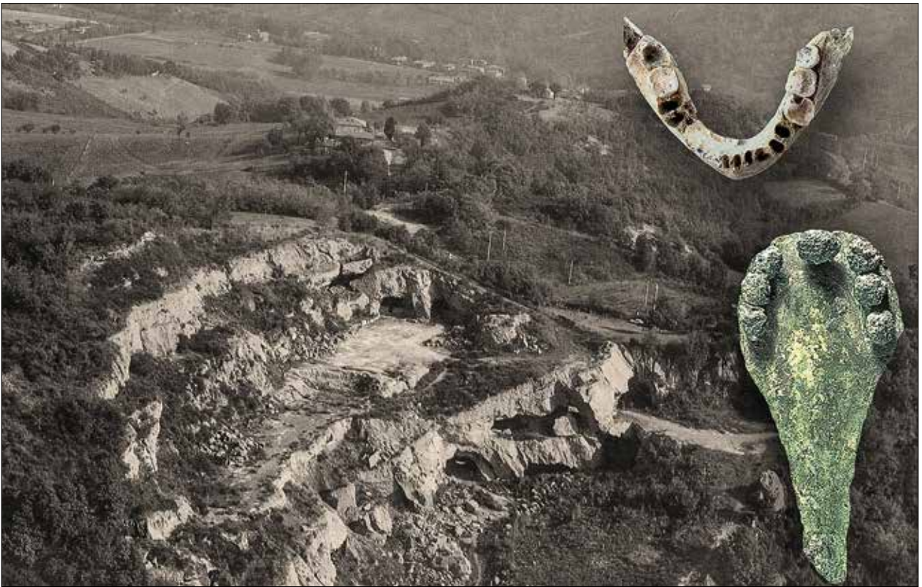
Fig. 9 - Monte Croara con i fronti estrattivi della Cava I.E.C.M.E. Mandibola umana e pugnaleto dell'età del Bronzo (Museo della Preistoria "L. Donini").

al 3800-3650 a.C. 22 . Il supporto delle analisi radiometriche, cui si è aggiunta ancor più di recente la datazione 23 ottenuta da una seconda mandibola rinvenuta, sempre grazie all'impegno del GSB-USB, nel Buco dell'Ossobuco, consegna dunque nuove conferme della grande precocità dei fenomeni di popolamento della zona dei Gessi già nelle fasi iniziali dell'età del Rame, se non poco prima. Un modello di antropizzazione permanente incardinata su un sistema di punti insediativi, con i relativi luoghi di sepoltura e ambiti quotidiani di riferimento, che privilegia i rilievi altimetrici maggiori trovando nelle risorse fornite dagli ecosistemi carsici la forma prescelta di adattamento territoriale.