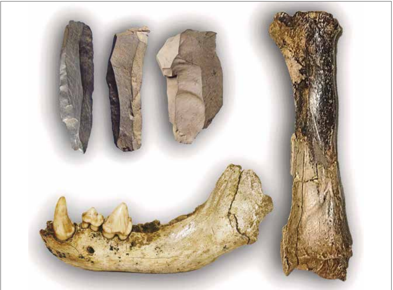
Fig. 11 - Grotta Serafino Calindri. Industria litica, emimandibola di Crocuta crocuta spelaea , radio di Bison priscus dai depositi del ramo intermedio. (Museo della Preistoria "L. Donini").